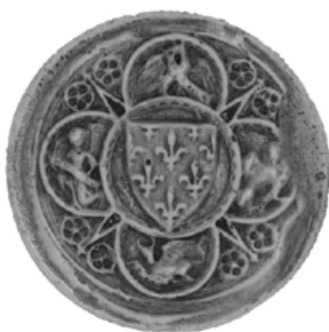
Sceau du secret de Philippe VI de Valois (1336).

En 2009, le SGDN devient SGDSN, et le SSD devient la « Direction de la protection et de la sécurité de l'État » (PSE) comprenant notamment une sous-direction « Protection et sécurité de la défense nationale » (SDPSDN).