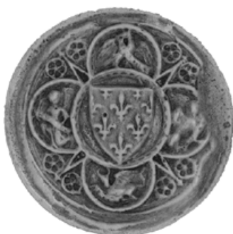
Sceau du secret de Philippe VI de Valois (1336).

En 2009, le SGDN devient SGDSN, et le SSD devient la « Direction de la protection et de la sécurité de l'État » (PSE) comprenant notamment une sous-direction « Protection et sécurité de la défense nationale » (SDPSDN).